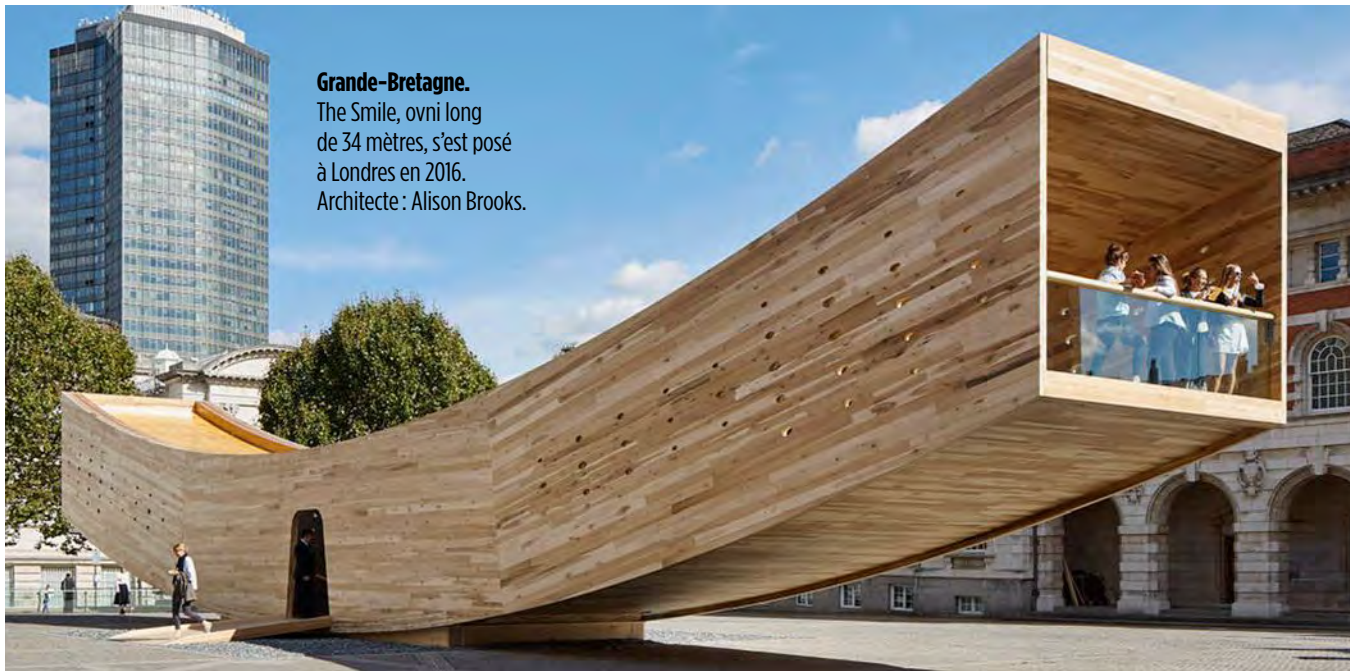
Grande-Bretagne. The Smile, ovni long de 34 mètres, s'est posé à Londres en 2016. Architecte : Alison Brooks.