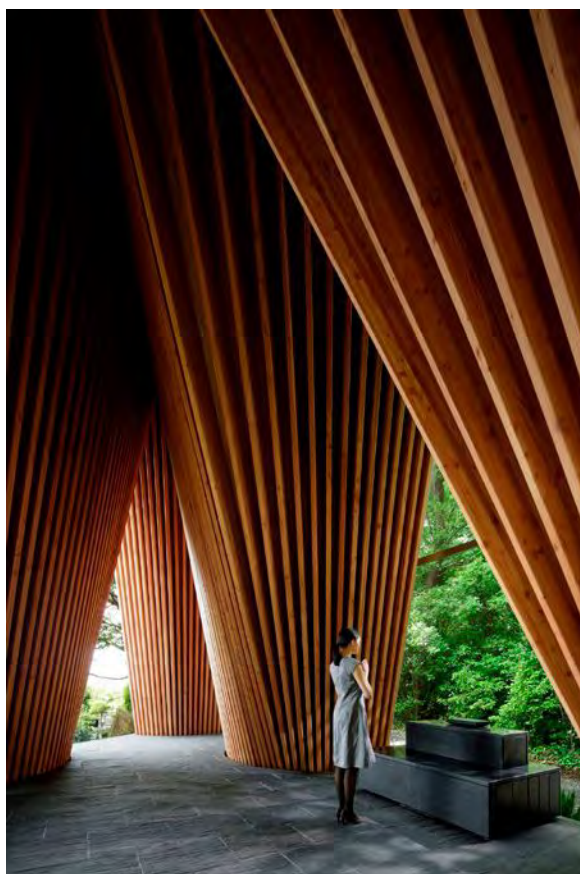
Japon. A Tokyo, les charpentes en mélèze de ce temple forment un V inversé évoquant les mains en prière. Architecte : Hiroshi Nakamura.

sance, à travers le développement des filières françaises locales aujourd'hui encore largement sous-exploitées : forêts, scieries, usines d'assemblage, etc.