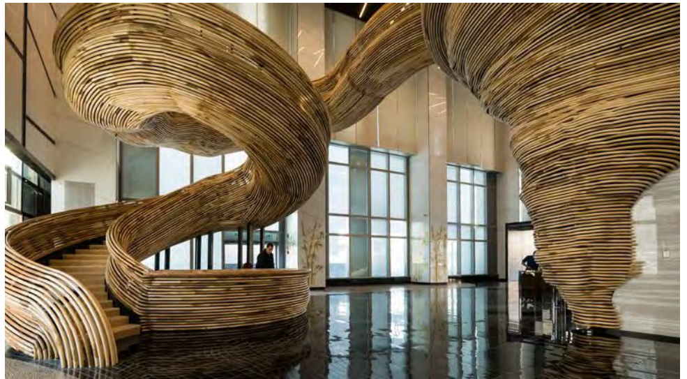
Israël. Tel-Aviv : 9 000 mètres de peuplier composent cet escalier de bureaux. Architectes : Oded Halaf, Tomer Gelfand.