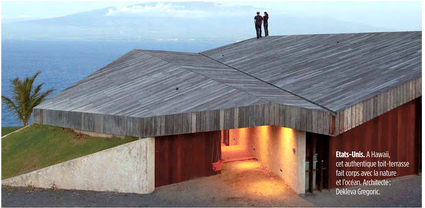
Etats-Unis. A Hawaii, cet authentique toit-terrasse fait corps avec la nature et l'océan. Architecte : Dekleva Gregoric.