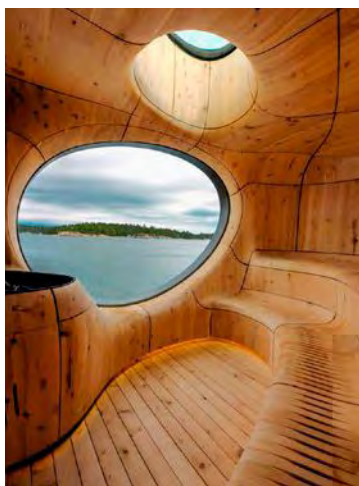
Canada. Grotto, sauna-cocon lové près de Toronto. Architecte : Partisans.

■■■ avant tout construire en structure comme un jeu de Meccano. « Léger, écolo, résistant au feu... Contrairement aux idées reçues, le bois est un matériau high-tech qui offre toutes les audaces constructives, notamment grâce aux nouvelles technologies numériques de conception, de préfabrication et d'assemblage », assure Pascal Gontier, qui déplore toutefois qu'en dépit de progrès en la matière il faudrait diminuer les produits d'imprégnation visant à lutter contre les insectes et les champignons, car leur bilan écologique est contestable. En dehors de cette remise en question, d'autres arguments physiolo-