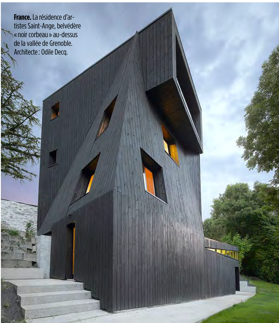
France. La résidence d'artistes Saint-Ange, belvédère « noir corbeau » au-dessus de la vallée de Grenoble. Architecte : Odile Decq.

■■■ avant tout construire en structure comme un jeu de Meccano. « Léger, écolo, résistant au feu... Contrairement aux idées reçues, le bois est un matériau high-tech qui offre toutes les audaces constructives, notamment grâce aux nouvelles technologies numériques de conception, de préfabrication et d'assemblage », assure Pascal Gontier, qui déplore toutefois qu'en dépit de progrès en la matière il faudrait diminuer les produits d'imprégnation visant à lutter contre les insectes et les champignons, car leur bilan écologique est contestable. En dehors de cette remise en question, d'autres arguments physiolo-