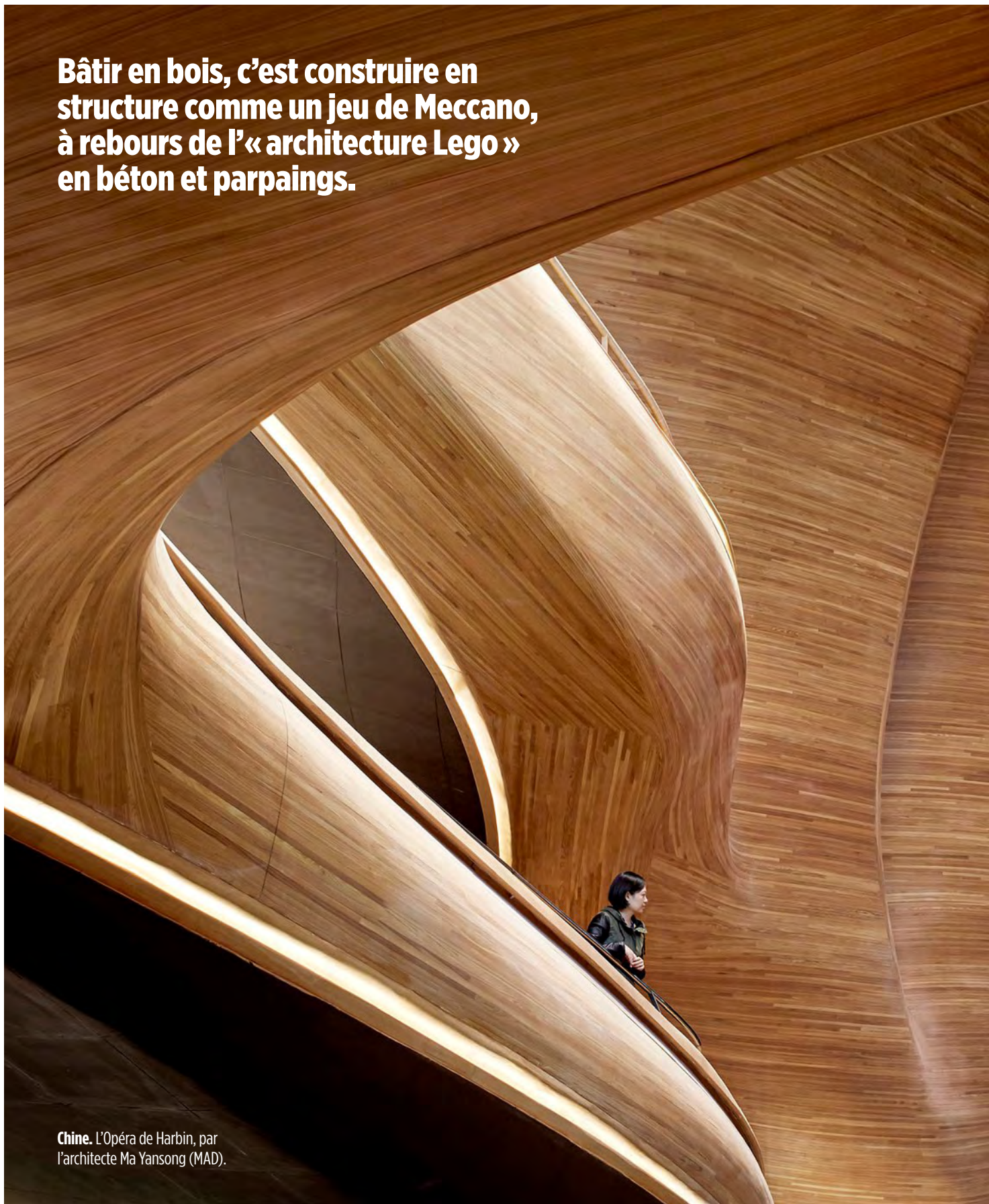
Chine. L'Opéra de Harbin, par l'architecte Ma Yansong (MAD).

Bâtir en bois, c'est construire en structure comme un jeu de Meccano, à rebours de l'« architecture Lego » en béton et parpaings.