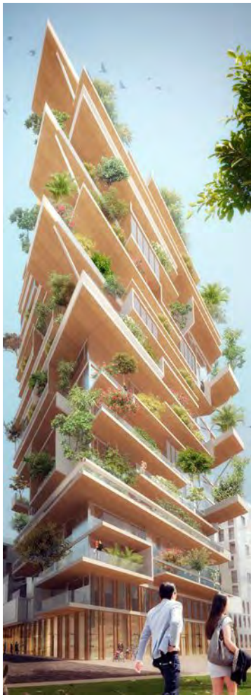
CRISTOBAL PALMA, JEAN-PAUL VIGUIER ET ASSOCIÉS, ITAY SIKOLSKI, MIKKEL FROST.