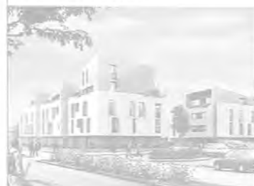
DAQUIN ET FERRIERE ARCHITECTURE

Dans le quartier du Val-Fourré, à l'emplacement des deux tours Ramon (220 logements au total) démolies en 2005, l'Opievoy construit 45 logements sociaux ( esquisse du projet, ci-dessus ). Il s'agit de la première opération de logement social réalisée dans le quartier depuis sa création dans les années soixante-dix. Conçu par l'agence Daquin et Ferrière, le programme comprend trois petits immeubles de type R+3 et R+4. Livraison prévue au premier semestre 2011. Entreprise: Eiffage Construction.